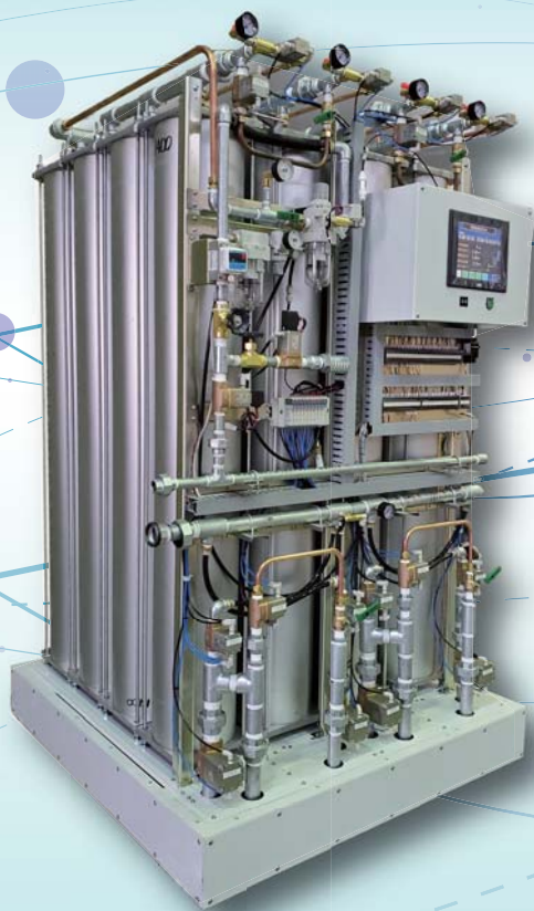
MODEL : LHPK4-400 (組み込み型)

ハイパフォーマンスシリーズに大型クラスの機種を追加！ 極限まで小型化と低騒音を実現