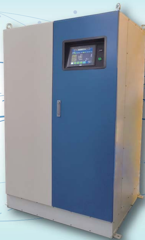
MODEL : LHP4-400