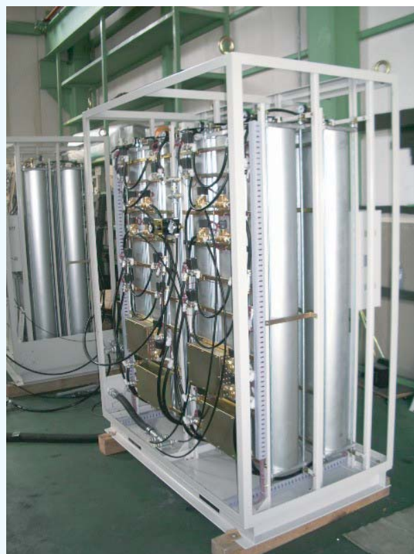
90% 12Nm 3 /H